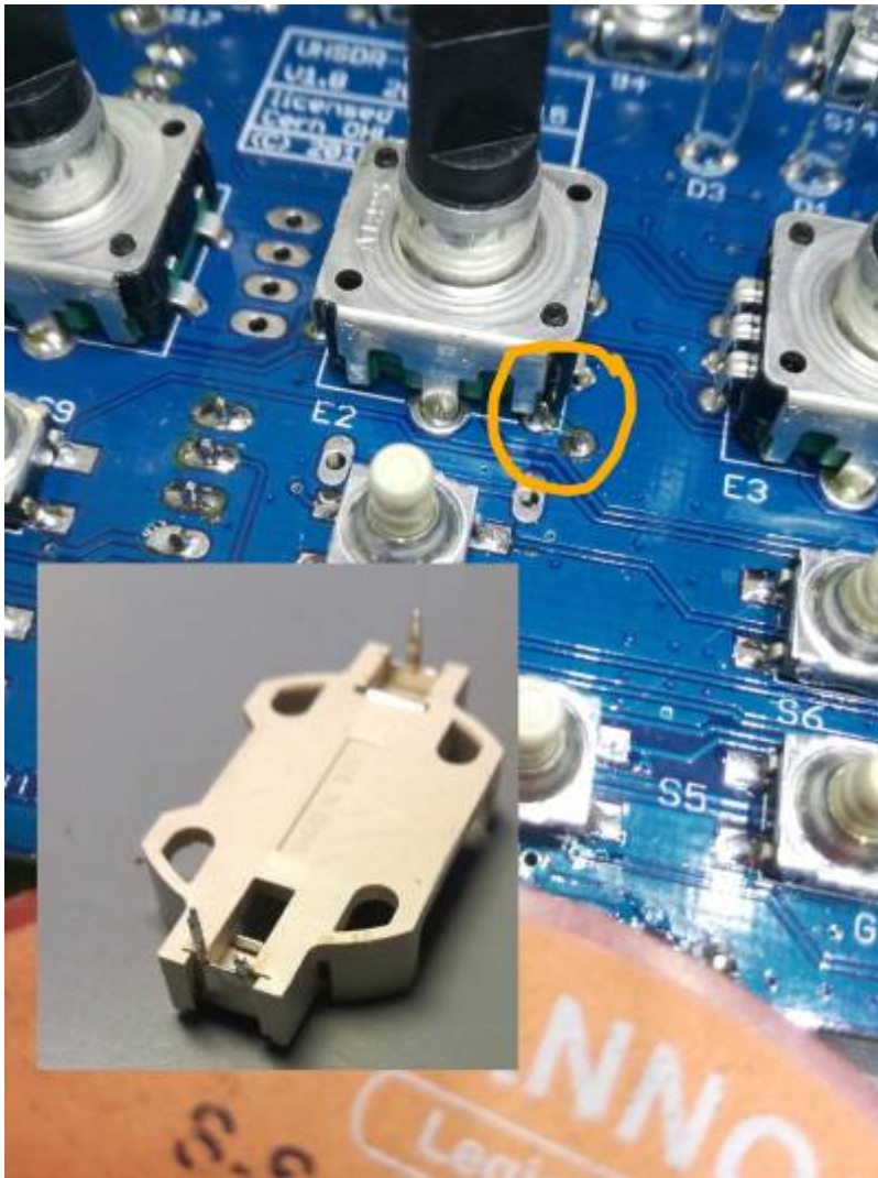
Potential Shortcut (photo DF9EH)