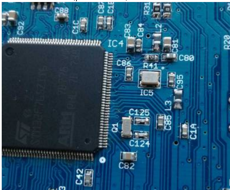
Orientation of TXCO & MCU

Note: Achtung: die MCU hat zwei (!) Pin 1 Markierungen