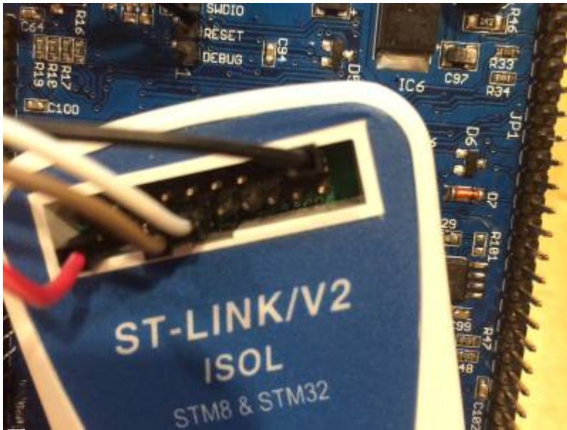
ST-Link connection to UI board

A couple of us faced the same issue during beta testing the new UI board. But as you could see a cheap chinese ST Link adapter from Amazon or eBay saves your day