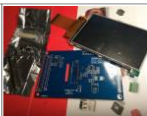
Display board