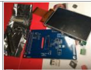
Displayboard, hier Ausführung zum Selberlöten