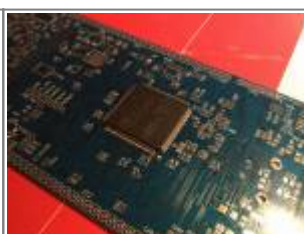
UI Board Platine