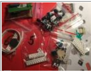
Bausatzbauteile in Tütchen

Der Bausatz beinhaltet Bauteile in Tütchen sortiert, Leiterplatte sowie Display