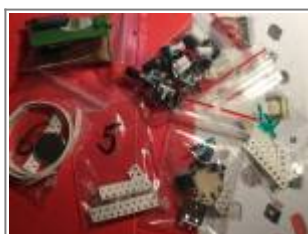
Bausatzbauteile in Tütchen

Der Bausatz beinhaltet Bauteile in Tütchen sortiert, Leiterplatte sowie Display