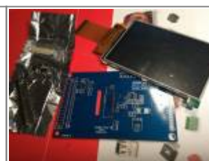
Displayboard, hier Ausführung zum Selberlöten