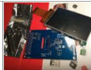
Displayboard, hier Ausführung zum Selberlöten