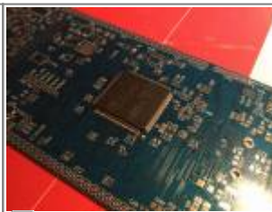
UI Board Platine