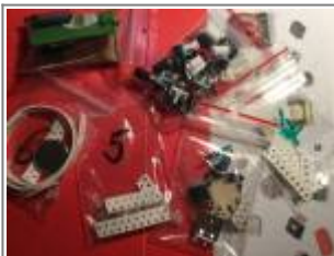
Bausatzbauteile in Tütchen

Der Bausatz beinhaltet Bauteile in Tütchen sortiert, Leiterplatte sowie Display