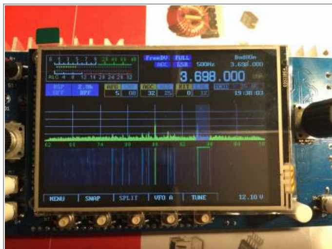
OVI40 3.5" display