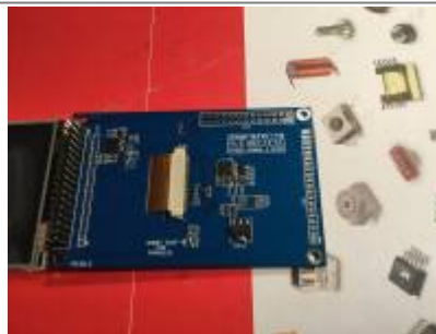
OVI40 3.5" display OVI40 3.5,, display, component side