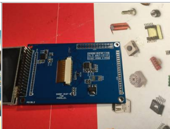
OVI40 3.5" display, vue de dessous